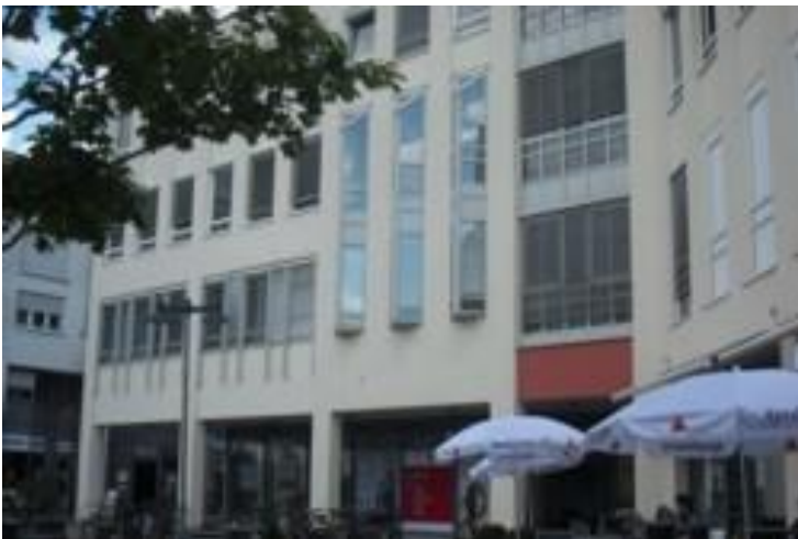
1.Stock links: unsere Beratungsstelle in den neuen Räumen

Die Beratungsstelle besteht seit 20.01.1975 und ist anerkannt nach § 218 StGB.