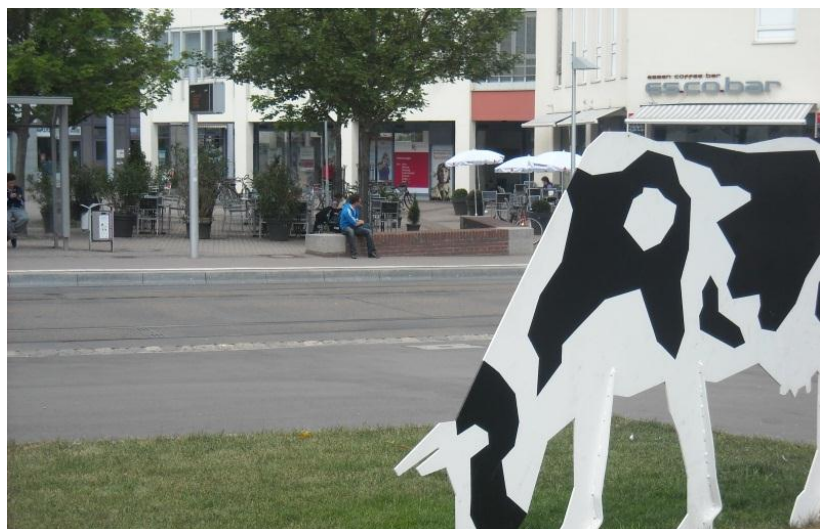
Blick vom Willy-Brandt-Platz